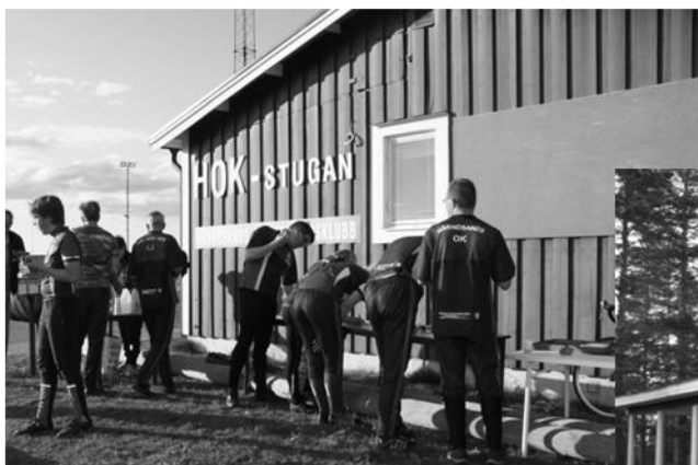
Klubbstugan på Höglätten

Frågan om klubbstuga är stor och symbolisk, och här finns historik och erfarenheter som är viktiga att fånga upp. Det är viktigt att diskussioner kan föras i positiv och konstruktiv anda, att farhågor kan belysas och risker undvikas, samt att beslut kan fattas i enighet för att gemensamt kunna gå vidare med kraft.