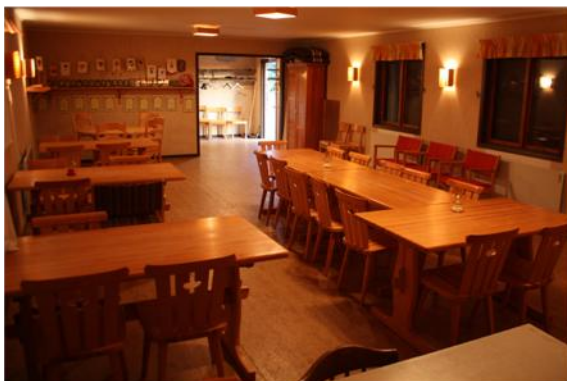
Samlingsrum och hall