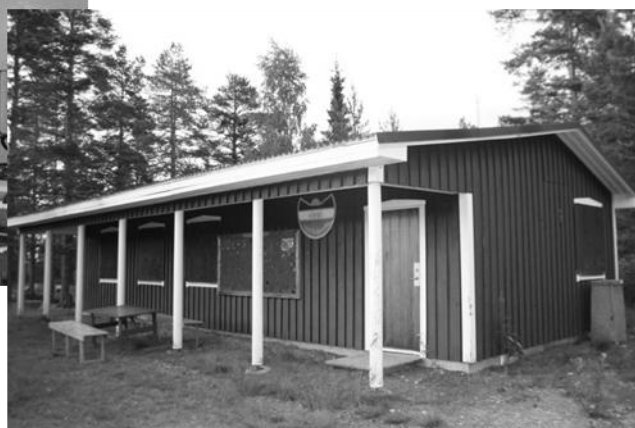
Härnö IF's klubbstuga på Vårdkasen