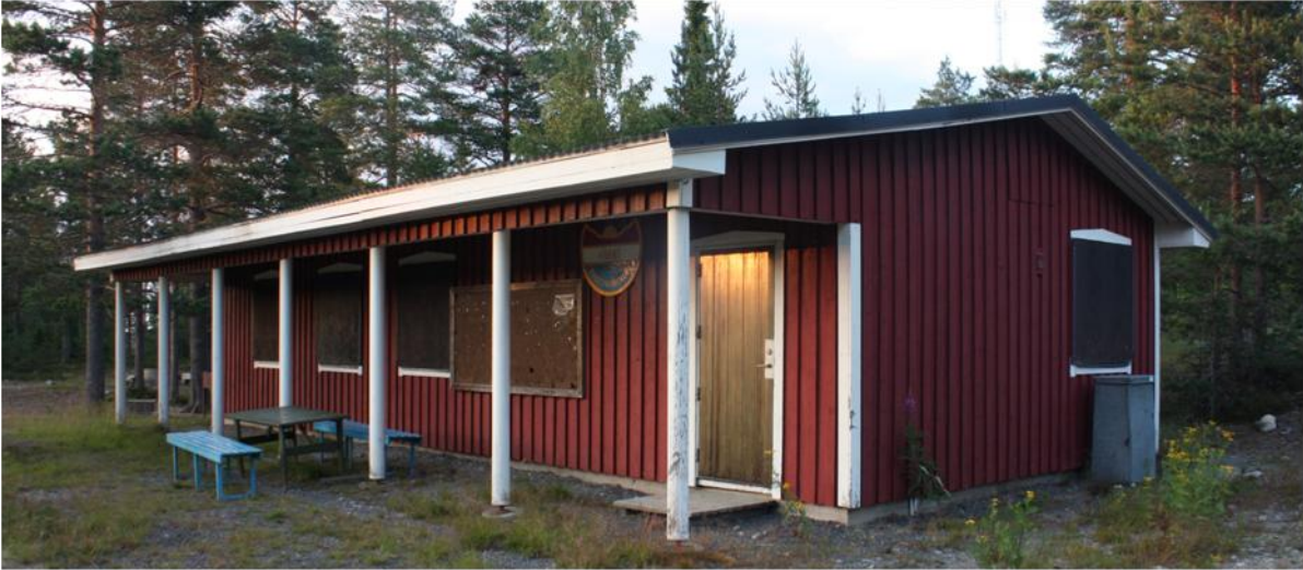
Härnö IF's klubbstuga vid skid-/bågskyttestadion på Vårdkasen